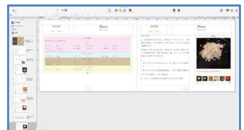
図3. iBooks Authorの例