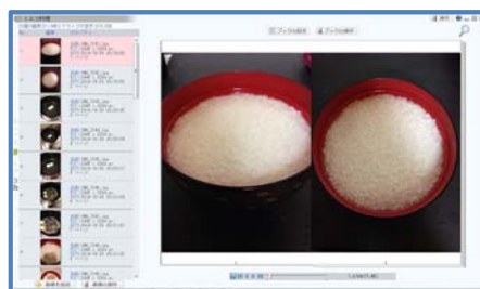
図2. メディアブックパブリッシャーの例