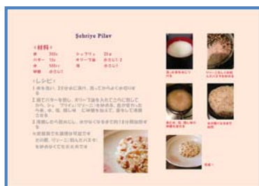
図1. Adobe InDesignの例