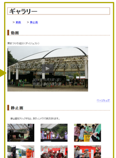
図4. ホームページ(ギャラリー)画面

〈ギャラリー〉 撮影した動画と静止画をもとに作成した動画と、データベースからいくつか選んだ静止画を掲載した。