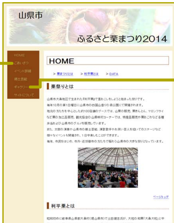
図3. ホームページ(HOME)画面

〈ごあいさつ〉 開会宣言やインタビューなどの動画と文字起こしの情報を合わせて表示させた。