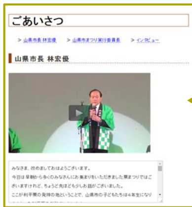
図2. ホームページ(ごあいさつ)画面

〈ごあいさつ〉 開会宣言やインタビューなどの動画と文字起こしの情報を合わせて表示させた。