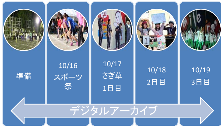
図1. さぎ草祭スケジュール

さぎ草祭の準備から、後夜祭までを記録した。スポーツ祭では、競技の様子をスタート地点、ゴール地点を中心に撮影した。さぎ草祭1日目から3日目は、野外ステージを中心に、模擬店、展示等の様子を撮影した。野外ステージは、ステージ全体とステージ中心の2種類の動画映像を、2台のビデオカメラを配置して撮影した。その他に、デジタルカメラで静止画撮影を行った