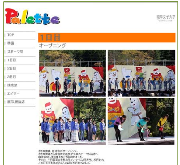
図3. ホームページの一例